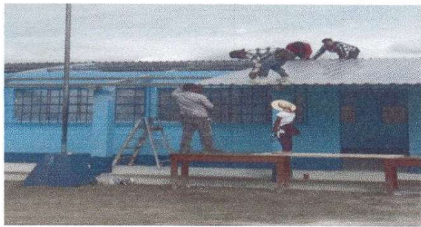
Foto1: Sustitución de cubierta de lámina por lámina troquelada aluzinc calibre 26