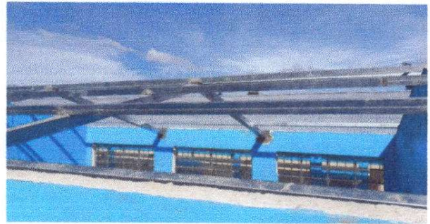
Foto 2: Estructura de techo, sustitución de soporte de madera por metal